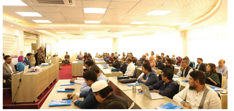
কর্মশালায় প্রধান অতিথি হিসেবে বক্তব্য প্রদান করছেন উপাচার্য