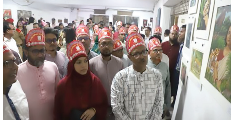
বিশ্ববিদ্যালয় দিবস আয়োজিত বার্ষিক চারুকলা ও আলোকচিত্র প্রদর্শনীতে ছবি দেখছেন উপাচার্য, ট্রেজারার ও শিক্ষকগণ

তিনি বলেন, শিগগিরই বিশ্ববিদ্যালয়ে ‘গবেষণা সপ্তাহ’ আয়োজন করা হবে, যা শিক্ষার্থী ও শিক্ষক উভয়ের জন্য গবেষণায় উৎসাহ জোগাবে। শিক্ষার্থীদের আবাসন সংকট নিরসন সময়সাপেক্ষ হলেও আমরা এই সমস্যার সমাধানে আন্তরিকভাবে কাজ করছি; আশা করছি আগামী বছরের মধ্যে আংশিক সমাধান সম্ভব হবে। সবশেষে তিনি বলেন, জগন্নাথ বিশ্ববিদ্যালয়ের অগ্রগতি ও মর্যাদা রক্ষায় আমাদের প্রতিটি পদক্ষেপই হবে আন্তরিকতার সঙ্গে, আর সেই প্রচেষ্টায় শিক্ষক, শিক্ষার্থী, কর্মকর্তা ও কর্মচারী-সবার সম্মিলিত প্রয়াসই হবে আমাদের প্রধান শক্তি।