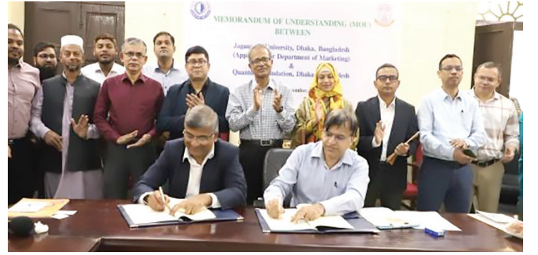
জগন্নাথ বিশ্ববিদ্যালয় ও কোয়ান্টাম ফাউন্ডেশনের এর মধ্যে চুক্তি স্বাক্ষর অনুষ্ঠান

জগন্নাথ বিশ্ববিদ্যালয়ের মার্কেটিং বিভাগের শিক্ষার্থীদের মানসিক সুস্থতা বৃদ্ধির লক্ষ্যে ২৪ নভেম্বর জগন্নাথ বিশ্ববিদ্যালয় ও কোয়ান্টাম ফাউন্ডেশন-এর মধ্যে একটি সমঝোতা স্মারক (MoU) স্বাক্ষরিত হয়েছে।