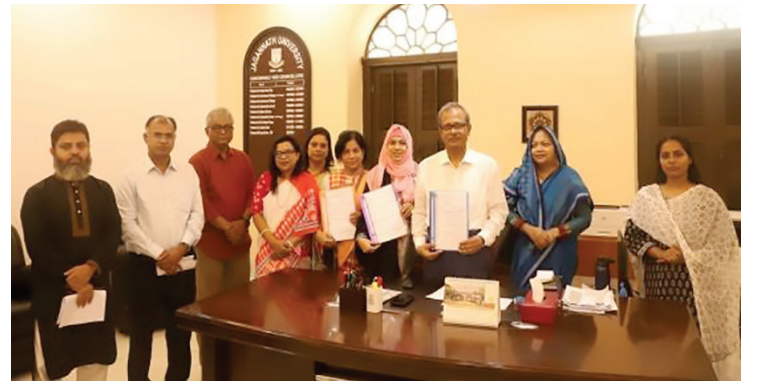
'জগন্নাথ ইউনিভার্সিটি জার্নাল অব আর্টস' ডিওআই প্রাপ্তি উপলক্ষ্যে উপাচার্যের সাথে সৌজন্য সাক্ষাতে কলা অনুষদের ডিন ও চেয়ারম্যানগণ