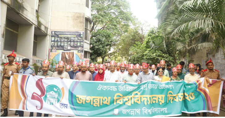
বিশ্ববিদ্যালয় দিবস উপলক্ষ্যে আয়োজিত র্যালির একাংশ

‘ঐক্যবদ্ধ জবিয়ান, স্বপ্ন জয়ে অটল প্রাণ’- এ প্রতিপাদ্যকে ধারণ করে জগন্নাথ বিশ্ববিদ্যালয় (জবি) দিবস ২০২৫ তথা বিশ্ববিদ্যালয়ের ২০তম প্রতিষ্ঠাবার্ষিকী ২৭ অক্টোবর পালিত হয়েছে। দিনব্যাপী আয়োজনে ছিল র্যালি, চারুকলা ও আলোকচিত্র প্রদর্শনী, আলোচনা সভা এবং দোয়া মাহফিলসহ নানা অনুষ্ঠান।