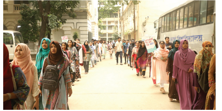
'ওয়ার্ল্ড মেন্টাল হেলথ ডে ২০২৫' উপলক্ষে আয়োজিত র্যালির একাংশ