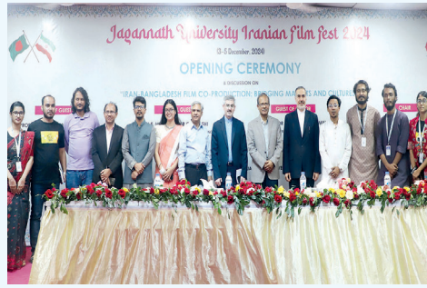
উদ্বোধনী অনুষ্ঠানে মঞ্চে রয়েছেন ইরানি রাষ্ট্রদূত, উপাচার্যসহ অন্যান্য অতিথিবৃন্দ

জগন্নাথ বিশ্ববিদ্যালয়ের ফিল্ম অ্যান্ড টেলিভিশন বিভাগ এবং ফিল্ম ক্লাবের যৌথ আয়োজনে এবং ঢাকাস্থ ইরানের দূতাবাসের কালচারাল সেক্টরের সহযোগিতায় তিন দিনব্যাপী (৩-৫ ডিসেম্বর, ২০২৪) ইরানি চলচ্চিত্র উৎসবের উদ্বোধন