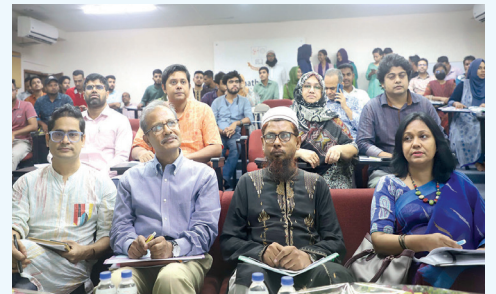
আন্তর্জাতিক প্রবীণ দিবস উপলক্ষে সেমিনারে অতিথি, আলোচক ও অংশগ্রহণকারী শিক্ষক-শিক্ষার্থীবৃন্দ

গত ১ অক্টোবর, ২০২৪ তারিখে ৩৪তম আন্তর্জাতিক প্রবীণ দিবস উপলক্ষে জগন্নাথ বিশ্ববিদ্যালয়ের সমাজকর্ম বিভাগ এবং সেন্টার ফর সোশ্যাল সায়েন্স রিসার্চ অ্যান্ড ট্রেনিং এর যৌথ আয়োজনে সিএসই বিভাগের ভার্সুয়াল কনফারেন্স রুমে 'দ্রুত পরিবর্তনশীল বাংলাদেশের প্রেক্ষাপটে প্রবীণদের সামাজিক নিরাপত্তা ও সুরক্ষা: প্রাতিষ্ঠানিক পরিচর্যা কি বিকল্প হতে পারে?' শীর্ষক সেমিনার অনুষ্ঠিত হয়।