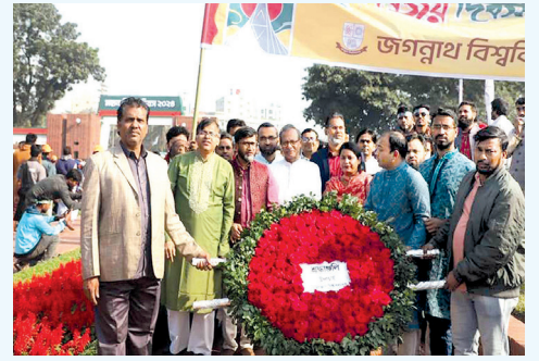
মহান বিজয় দিবসে জগন্নাথ বিশ্ববিদ্যালয়ের পক্ষে শ্রদ্ধাঞ্জলি নিবেদন