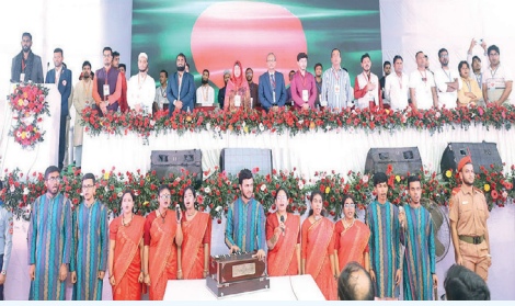
জাতীয় সংগীত পরিবেশনের মধ্য দিয়ে 'বিপ্লবোত্তর ছাত্র ঐক্য' শীর্ষক আলোচনা সভার উদ্বোধনী মুহূর্ত

জুলাই বিপ্লবের চেতনাকে সমুন্নত রেখে জাতীয় ঐক্যকে শক্তিশালী করার লক্ষ্যে জগন্নাথ বিশ্ববিদ্যালয়ের সাংবাদিক জোটের আয়োজনে ৪ ডিসেম্বর, ২০২৪ বিশ্ববিদ্যালয়ের বিজ্ঞান ভবন চত্বরে দেশের বিভিন্ন ছাত্র সংগঠনের নেতৃবৃন্দের অংশগ্রহণে 'বিপ্লবোত্তর ছাত্র ঐক্য' শীর্ষক সভা অনুষ্ঠিত হয়।