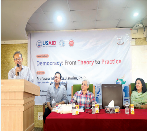
ট্রেনিং প্রোগ্রামের উদ্বোধনী অনুষ্ঠানে বক্তব্য প্রদান করছেন উপাচার্য