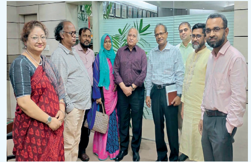
ইউজিসি চেয়ারম্যান-এর সাথে উপাচার্যের নেতৃত্বে জগন্নাথ বিশ্ববিদ্যালয় প্রতিনিধি দল

এসব বৈঠকে ১২ নভেম্বর শিক্ষা মন্ত্রণালয়ে অনুষ্ঠিত বৈঠকে জগন্নাথ বিশ্ববিদ্যালয়ের দ্বিতীয় ক্যাম্পাস প্রকল্পের চলমান কার্যক্রম সম্পর্কে গৃহীত সিদ্ধান্তসমূহ বাস্তবায়ন ও বিশ্ববিদ্যালয়ের অন্যান্য বিষয়ে ফলপ্রসূ আলোচনা হয়।