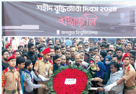
শহিদ বুদ্ধিজীবী দিবসে জগন্নাথ বিশ্ববিদ্যালয়ের পক্ষে শ্রদ্ধাঞ্জলি নিবেদন

১৪ ডিসেম্বর, ২০২৪ শহিদ বুদ্ধিজীবী দিবস উপলক্ষে সূর্যোদয়ের সঙ্গে সঙ্গে জগন্নাথ বিশ্ববিদ্যালয় ক্যাম্পাসে জাতীয় পতাকা অর্ধনমিত ও কালো পতাকা উত্তোলন করা হয় এবং বিশ্ববিদ্যালয়ের সকলে কালো ব্যাজ ধারণ করেন। শহিদ বুদ্ধিজীবী দিবস উপলক্ষে জাতির শ্রেষ্ঠ সন্তানদের স্মৃতির প্রতি জগন্নাথ বিশ্ববিদ্যালয়ের উপাচার্য-এর নেতৃত্বে মিরপুর বুদ্ধিজীবী কবরস্থানে এবং শহিদ বুদ্ধিজীবী স্মৃতিসৌধে পুষ্পার্ঘ্য অর্পণ করে শ্রদ্ধাঞ্জলি নিবেদন করা হয়।