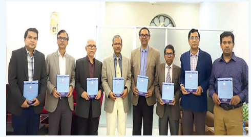
জার্নাল অব সায়েন্স এর মোড়ক উন্মোচন করছেন উপাচার্য