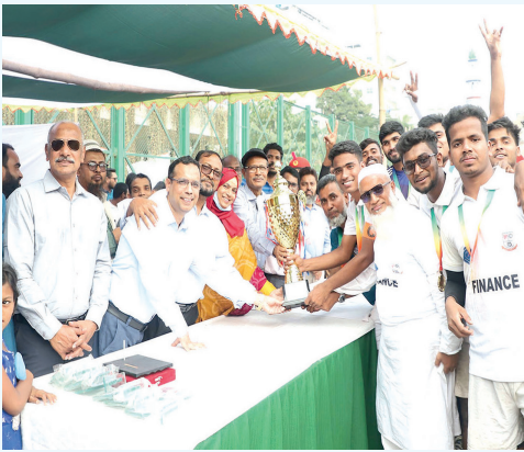
বিজয়ীদের মাঝে পুরস্কার তুলে দিচ্ছেন উপাচার্য ও ট্রেজারার

জগন্নাথ বিশ্ববিদ্যালয়ের ক্রীড়া উপ-কমিটির (ফুটবল ও হকি) আয়োজনে এবং শরীরচর্চা শিক্ষা কেন্দ্রের সহযোগিতায় ২ ডিসেম্বর, ২০২৪ কেন্দ্রীয় খেলার মাঠে (ধূপখোলা) ৭ম আন্তঃবিভাগ ফুটবল প্রতিযোগিতা ২০২৪ এর পুরস্কার বিতরণী অনুষ্ঠিত হয়। ফাইনাল খেলায় ফিন্যান্স বিভাগ টাইব্রেকারে ৪-৩ গোলে ইংরেজি বিভাগকে হারিয়ে চ্যাম্পিয়ন হওয়ার গৌরব অর্জন করে।