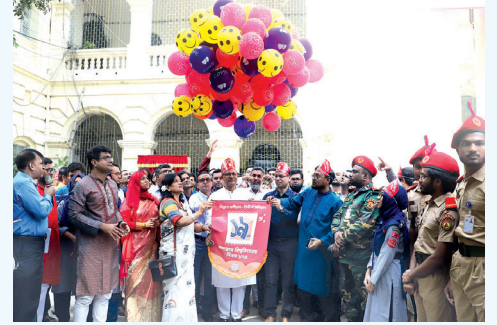
১৯তম জগন্নাথ বিশ্ববিদ্যালয় দিবসের উদ্বোধন করছেন উপাচার্য

জগন্নাথ বিশ্ববিদ্যালয় ঘোষণা ফলক (পুনঃস্থাপন) উন্মোচন, চারুকলা ও আলোকচিত্র প্রদর্শনী, নবীন শিক্ষার্থীদের সংশ্লিষ্ট বিভাগে, ইন্সটিটিউটে ও কেন্দ্রীয়ভাবে বরণ, দোয়া মাহফিল ও সাংস্কৃতিক অনুষ্ঠান।