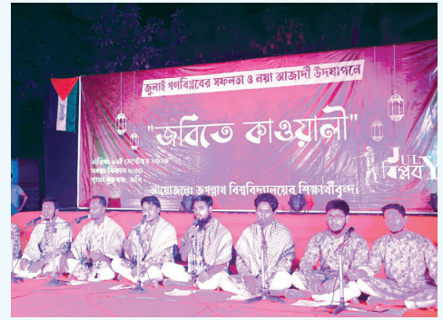
কাওয়ালি উৎসবের বিশেষ মুহূর্ত