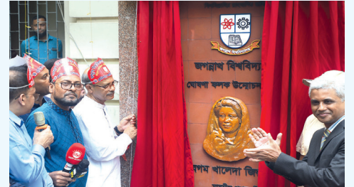
জগন্নাথ বিশ্ববিদ্যালয়ের ঘোষণা ফলক (পুনঃস্থাপন) উন্মোচন করছেন উপাচার্য