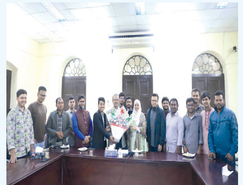
উপাচার্য ও ট্রেজারার এর সাথে ফুলেল শুভেচ্ছা বিনিময় করছেন নবনির্বাচিত সাংবাদিক সমিতির সদস্যগণ

উপাচার্য ও ট্রেজারার এর সাথে ফুলেল শুভেচ্ছা বিনিময় করেন নবনির্বাচিত সাংবাদিক সমিতির সদস্যগণ। উপাচার্য নবনির্বাচিত কমিটিকে আন্তরিক অভিনন্দন জানান এবং সাংবাদিকতার আদর্শ ও নৈতিকতা বজায় রেখে বিশ্ববিদ্যালয়ের ইতিবাচক ভাবমূর্তি তুলে ধরার আহ্বান জানান। সাক্ষাৎকালে উপাচার্য বিশ্ববিদ্যালয়ের সামগ্রিক উন্নয়ন, শিক্ষা ও গবেষণার অগ্রগতি এবং প্রশাসনের বিভিন্ন কার্যক্রমের স্বচ্ছতা ও গতিশীলতা বৃদ্ধিতে সাংবাদিকদের ভূমিকার ওপর গুরুত্বারোপ করেন।