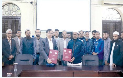
জগন্নাথ বিশ্ববিদ্যালয় এবং আস-সুন্নাহ ফাউন্ডেশন-এর মাঝে চুক্তি স্বাক্ষর অনুষ্ঠান

সমঝোতা স্মারকের আওতায় উভয়পক্ষের প্রতিনিধিদের নিয়ে পাঁচ সদস্যের একটি পরামর্শক বোর্ড গঠন করা হবে। এই বোর্ড প্রকল্প পরিচালনা এবং সমস্যার সমাধান করবে।