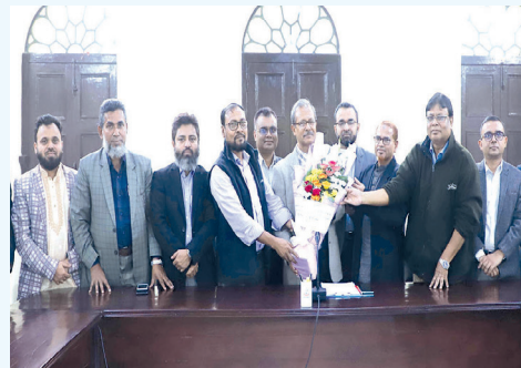
উপাচার্যের সাথে ফুলের শুভেচ্ছা বিনিময় করছেন নবনির্বাচিত শিক্ষক সমিতি

সহ-সভাপতি পদে অর্থনীতি বিভাগের অধ্যাপক ড. মোঃ