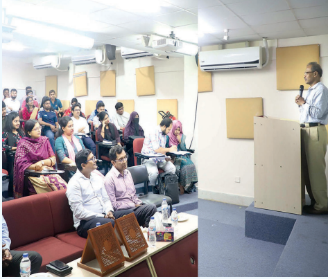
সেমিনারে প্রধান অতিথি হিসেবে বক্তব্য প্রদান করছেন উপাচার্য

সাইবার নিরাপত্তা ও সচেতনতা বৃদ্ধিতে জগন্নাথ বিশ্ববিদ্যালয়ের কম্পিউটার সায়েন্স অ্যান্ড ইঞ্জিনিয়ারিং বিভাগ, IEEE Jagannath University Student Branch Ges IEEE Computer Society, Jagannath University Student Branch Chapter Gi যৌথ উদ্যোগে 'Emerging Threat Landscape' শীর্ষক সেমিনার গত ২ অক্টোবর, ২০২৪ বিভাগীয় ভার্চুয়াল কনফারেন্স রুমে অনুষ্ঠিত হয়।