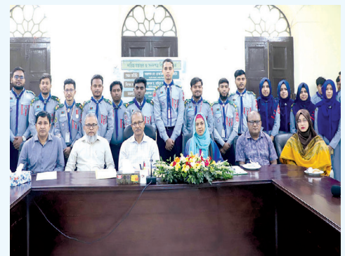
উপাচার্য ও ট্রেজারার এর সাথে রোভার-ইন-কাউন্সিলের সদস্যগণ

প্রার্থনা সংগীত পরিবেশনার মাধ্যমে জগন্নাথ বিশ্ববিদ্যালয় রোভার স্কাউট গ্রুপের রোভার ইন কাউন্সিল ২০২৩-২০২৪ কর্তৃক ২০২৪-২০২৫ কাউন্সিলকে দায়িত্ব হস্তান্তর ও সদস্যদের মাঝে বার্ষিক সনদ বিতরণ ১৪ নভেম্বর ২০২৪ উপাচার্যের কনফারেন্স রুমে অনুষ্ঠিত হয়।