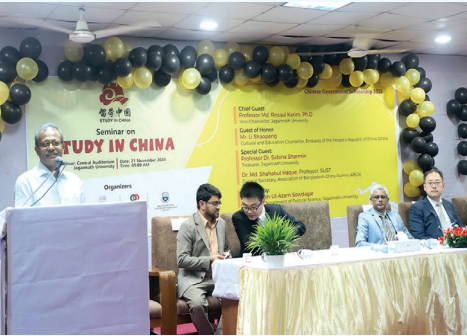
সেমিনারে প্রধান অতিথি হিসেবে বক্তব্য রাখছেন উপাচার্য

জগন্নাথ বিশ্ববিদ্যালয়ের রাষ্ট্রবিজ্ঞান বিভাগের উদ্যোগে ঢাকাস্থ চীনা দূতাবাস ও এসোসিয়েশন অব বাংলাদেশ চায়না এলামনাই (এবকা) এর যৌথ আয়োজনে ২১ নভেম্বর বিশ্ববিদ্যালয়ের কেন্দ্রীয় মিলনায়তনে 'চীনে উচ্চশিক্ষা' বিষয়ক সেমিনার আয়োজিত হয়।