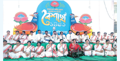
বর্ষবরণ উপলক্ষে আয়োজিত সংগীতানুষ্ঠানে মনোমুগ্ধকর গান পরিবেশন করছেন সংগীত বিভাগের শিক্ষক ও শিক্ষার্থীরা